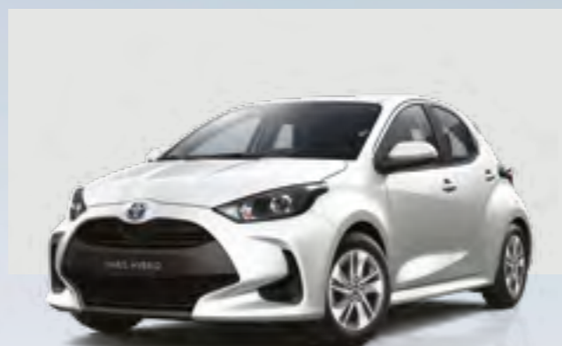
לבן צחור 040