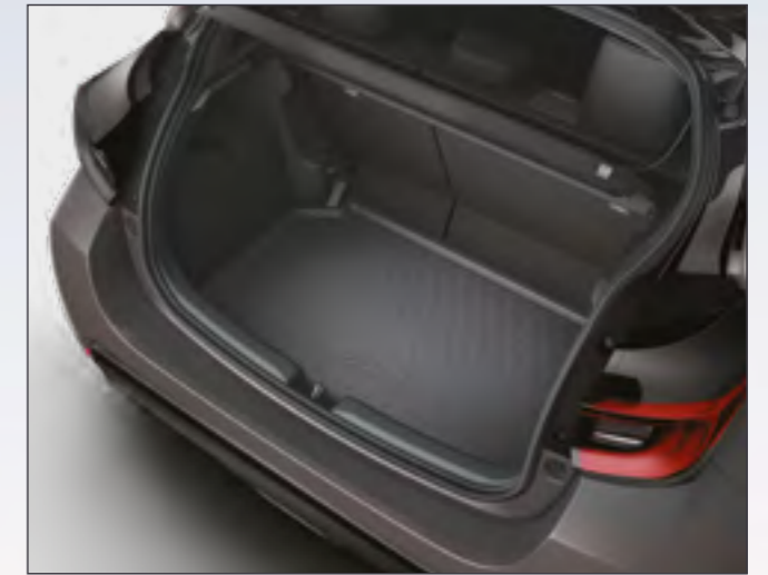
אמבטיה לתא המטען המספקת הגנה מפני לכלוך ומפני החלקה של ציוד וסחורה