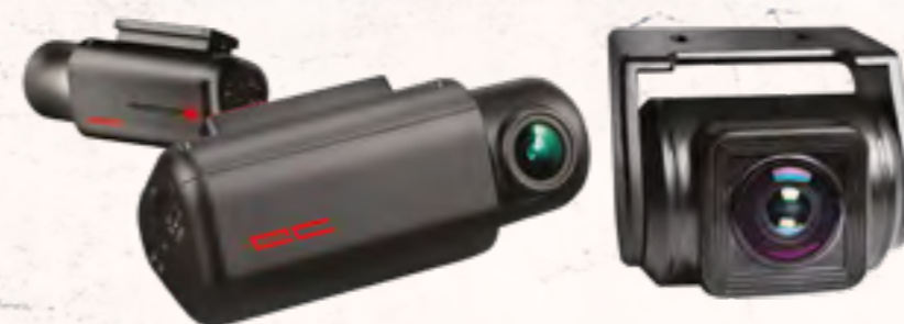
מצלמת DVR מצלמת דרך קדמית ואחורית מתעדת כל אירוע בכביש