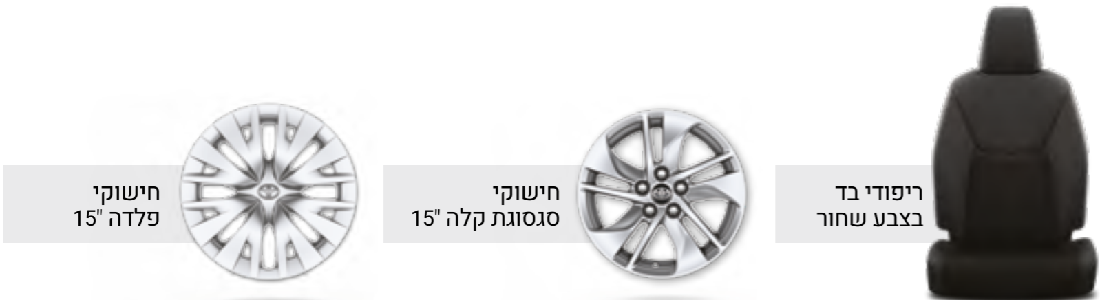
חישוקי פלדה 15"

*בכפוף לתאימות הטלפון הנייד שברשותך להתקן ה-Bluetooth ברכב. **נכון למועד פרסום קטלוג זה, אפליקציית Android Auto אינה זמינה בישראל. ***פעילות ה-E-call תלויה ברשת הסלולרית הנמצאת בקרבת הרכב בעת שידור המידע.