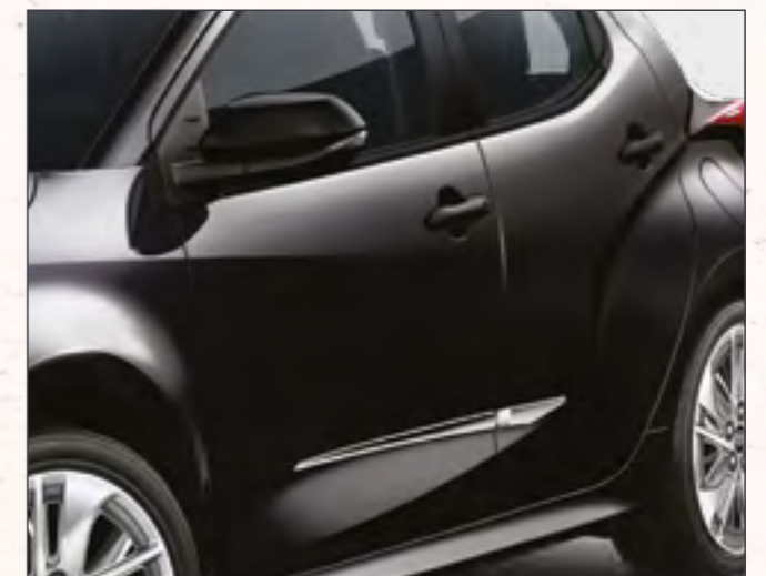
סט פסי קישוט בצבע כרום שיוספקו ליאריס שלך מראה קלאסי בעל נגיעה אלגנטית