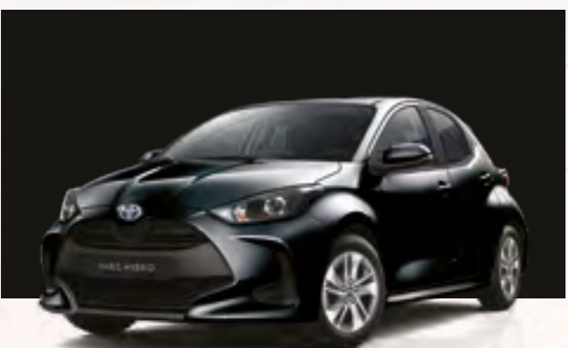
שחור מטאלי 209