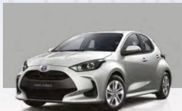
כסוף מטאלי 1L0