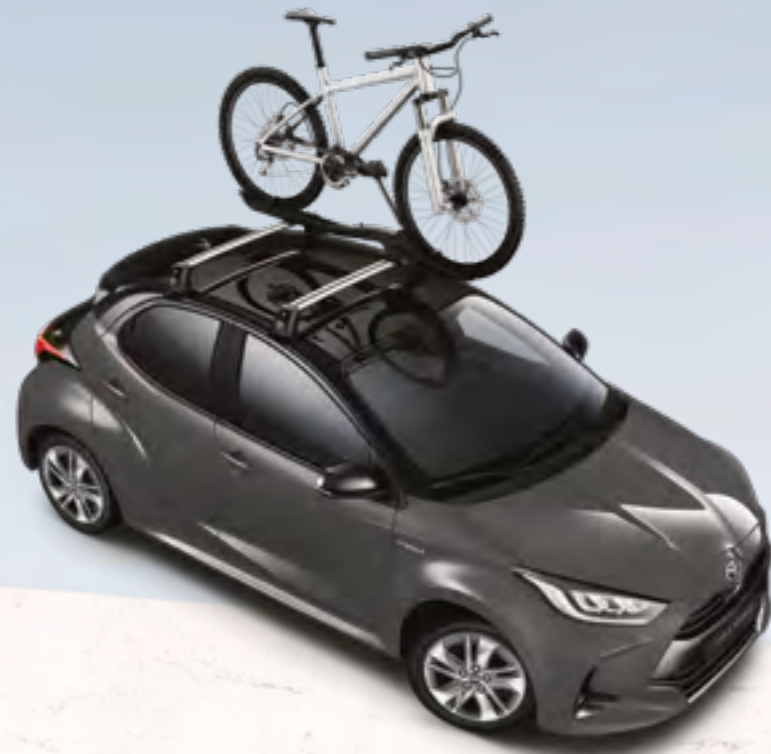
מוטות-רוחב, עבור מגוון אביזרי גג ומתקני אופניים