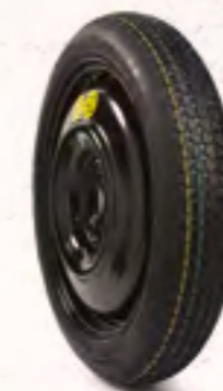
ערכת גלגל רזרבי וקומפקטי לניצול מקסימלי של נפח תא המטען