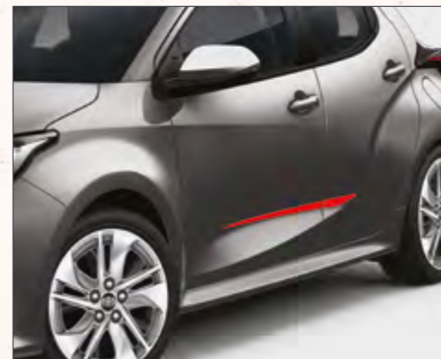
סט פסי קישוט בצבע אדום שיגרמו לראשים להסתובב בזכות נגיעת הצבע הנועזת שהם מוסיפים לרכב