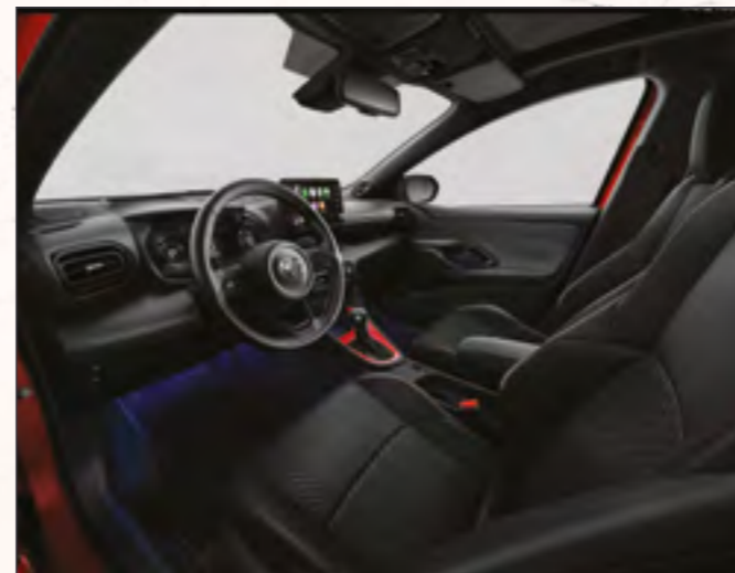
קישוט קונסולה מרכזית בצבע אדום שיהפוך את היאריס שלך לייחודית מבפנים כפי שהיא מבחוץ