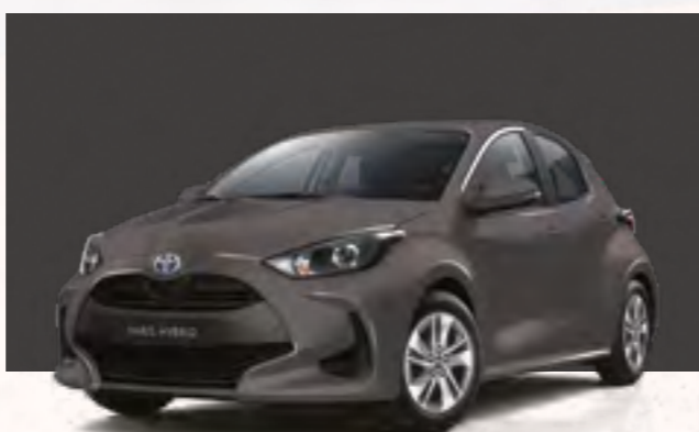
אפור מטאלי 1G3