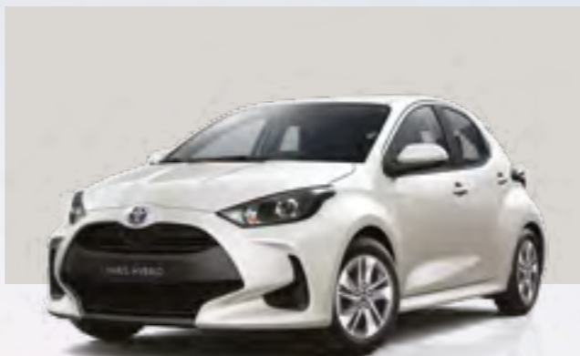
לבן פנינה מטאלי 089