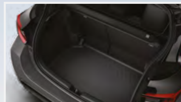
פסי הגנה לדלתות ואמבטיה לתא מטען המספקים הגנה מפני שריטות ופיגועות קוסמטיות