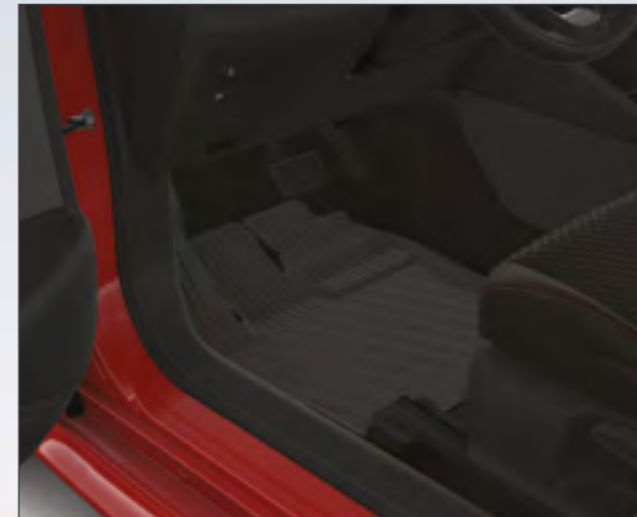
שטיחי גומי המגנים על פנים הרכב מפני לכלוך וניתנים להסרה ולניקוי פשוט