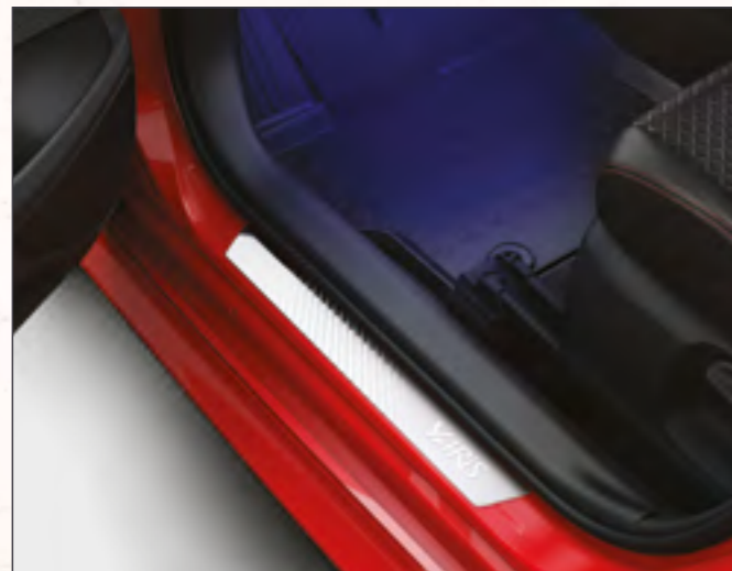
סט קישוטי סף קדמיים מקוריים היוצרים רושם מידי של סטייל, ובמקביל מגנים על סף הדלת מפני לכלוך ושריטות