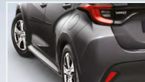
פסי הגנה לדלתות ואמבטיה לתא מטען המספקים הגנה מפני שריטות ופיגועות קוסמטיות