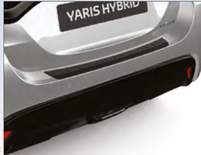
מגן פגוש אחורי המגן על הפגוש בעת טעינה ופריקה של סחורה מתא המטען